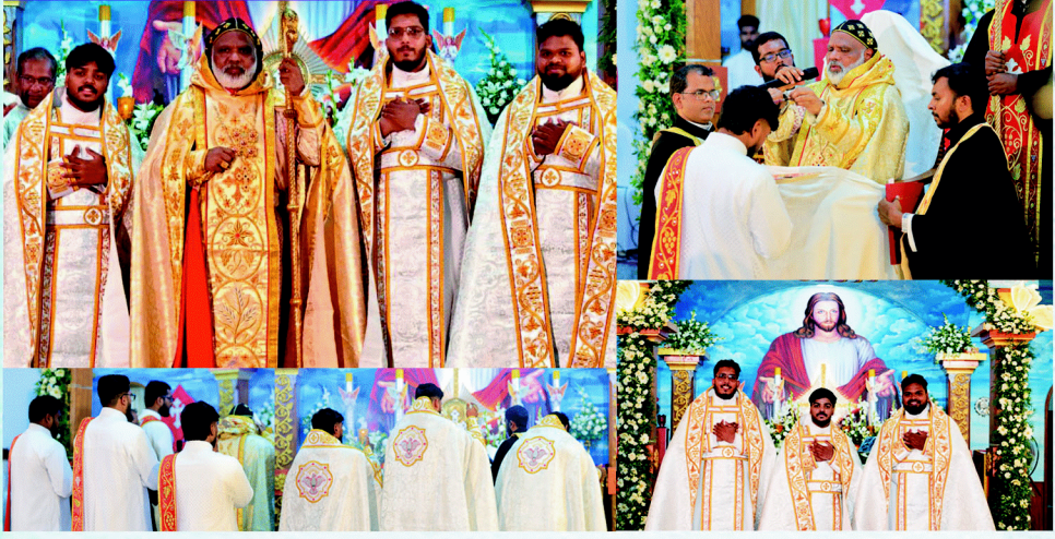
குருக்களுக்கான தொடர் உருவாக்க பயிற்சி